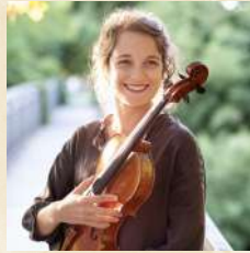
Oriane Pocard-Kieny, alto